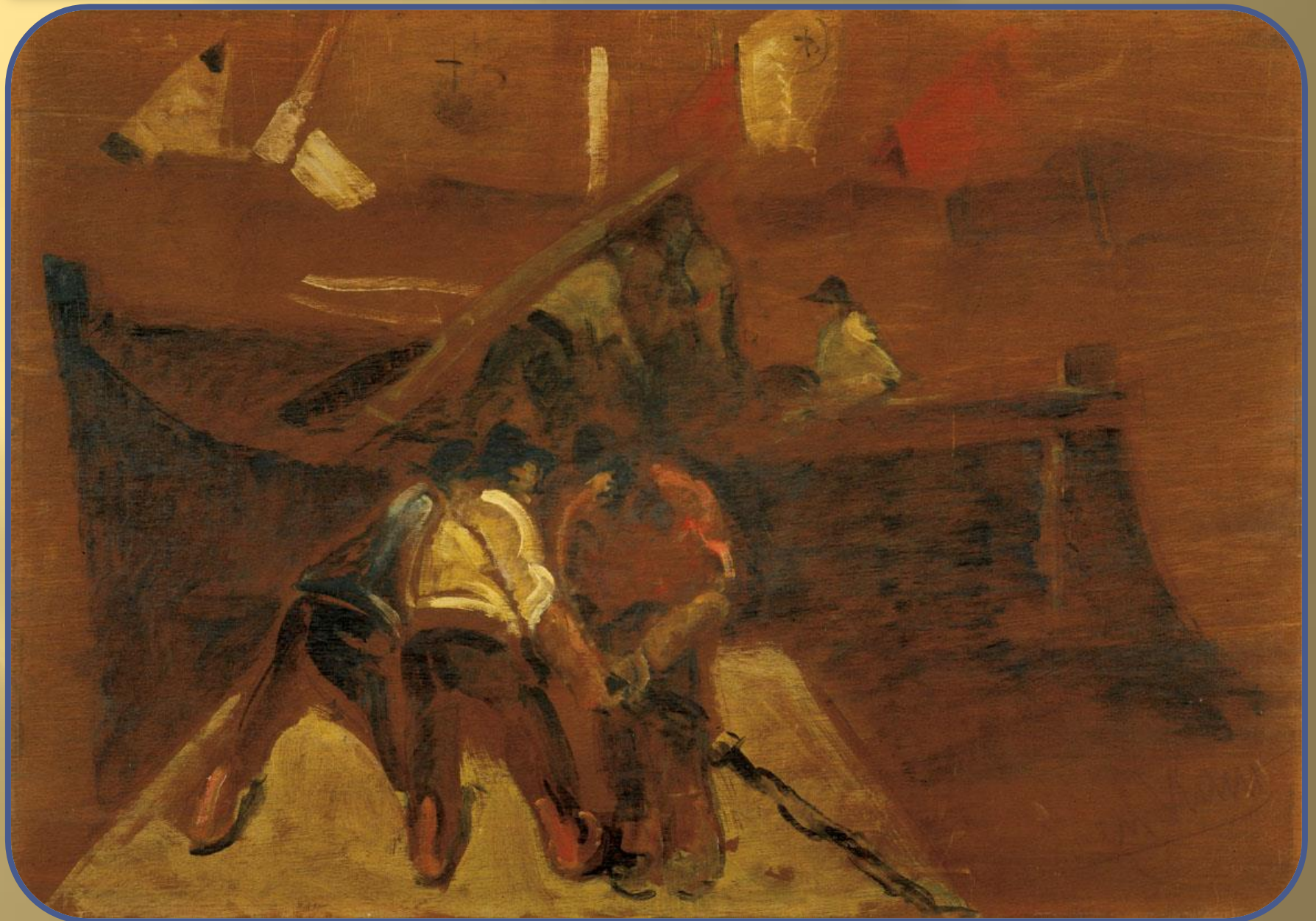
Lorenzo Viani - "Gli scaricatori" - 1930