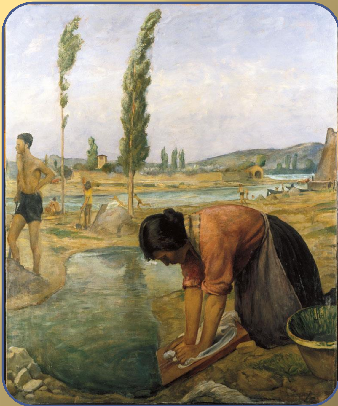
Baccio Bacci Sera sull'Arno 1934