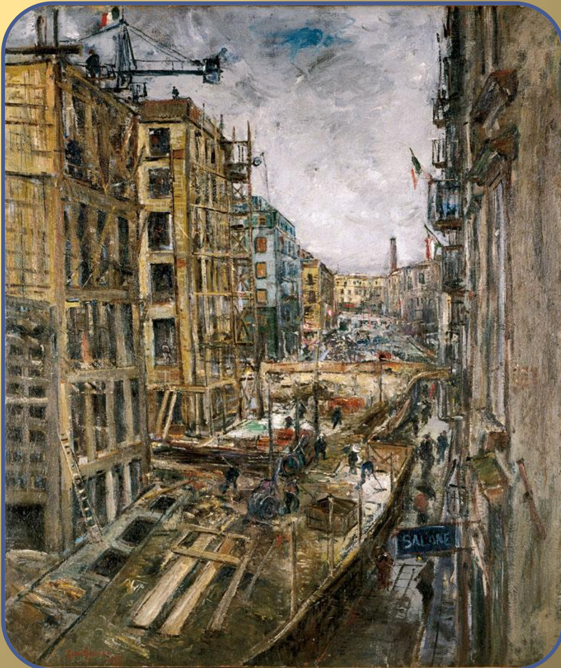
Guido Casciaro "Ricostruzione del regime a Napoli" 1936