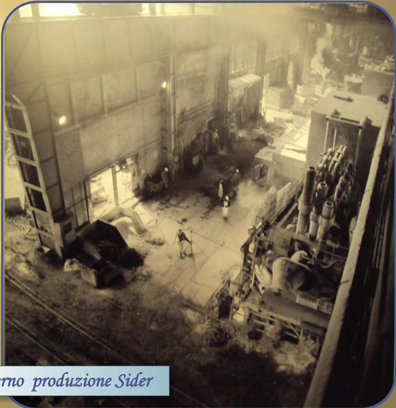
Interno produzione Sider