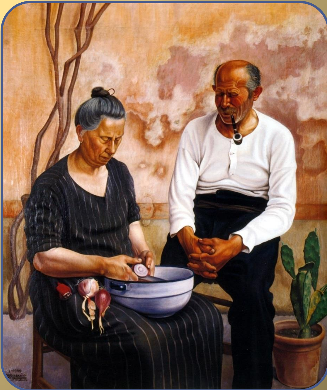
Cagnaccio da San Pietro Le lacrime della cipolla 1929