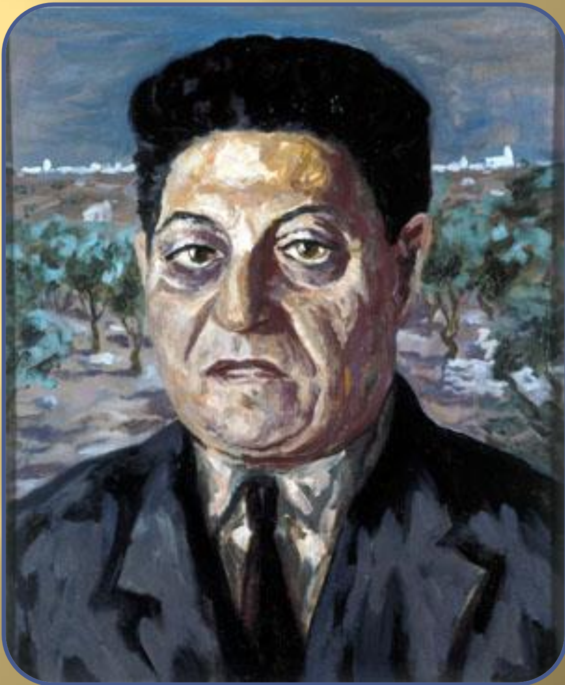
Carlo Levi "Giuseppe di Vittorio" 1952