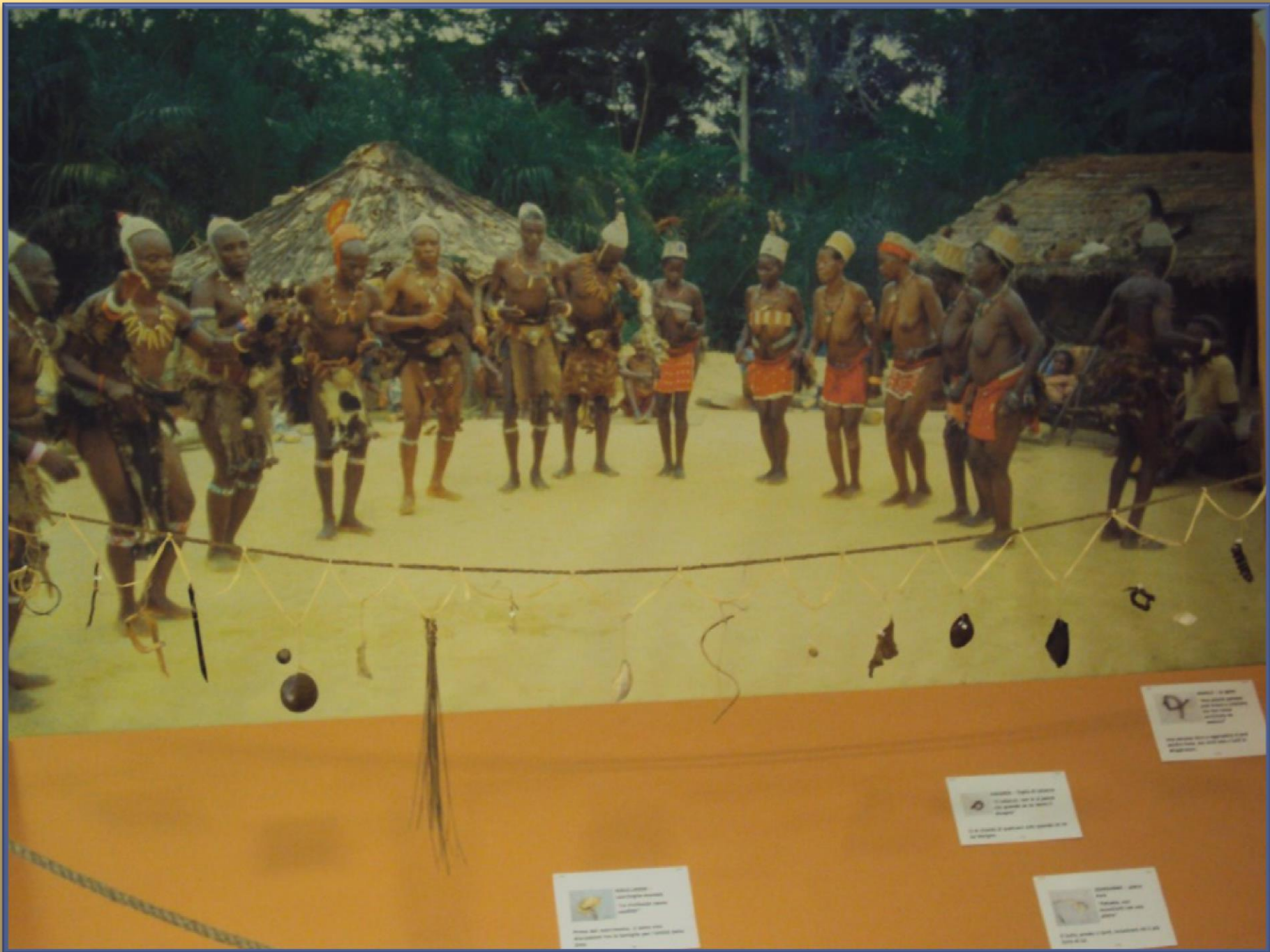
Objeto de adorno Este objeto es un collar de cuentas de madera y se utiliza para decorar el cuerpo durante las ceremonias.