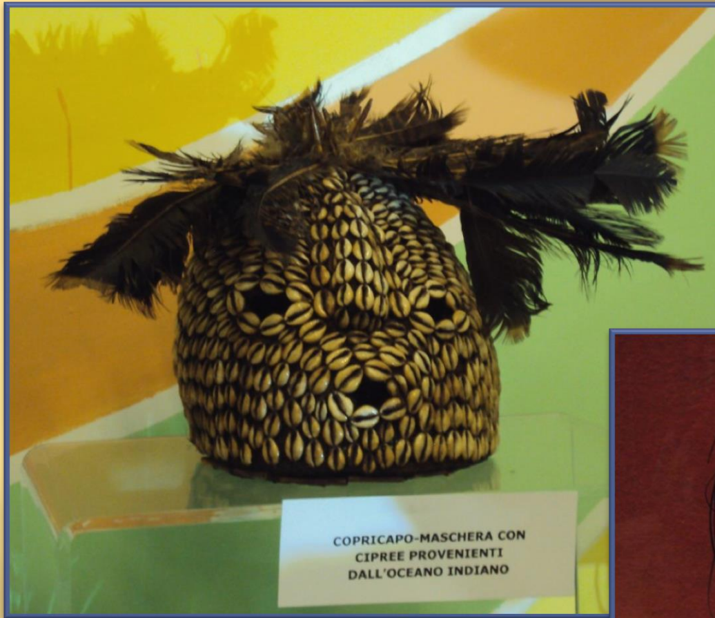
COPRICAPO-MASCHERA CON CIPREE PROVENIENTI DALL'OCEANO INDIANO