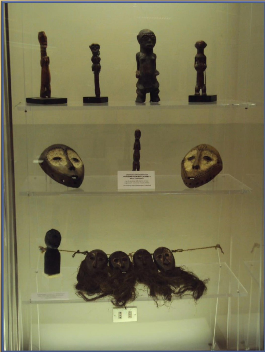
CRUCIFISSA IN MATERIA DELLA MENTE DI BAMBINO NELLA LINEA MOLA Un'opera in legno scuro del gruppo di scultori di Bafra, con immagini antropomorfe e stilizzate.