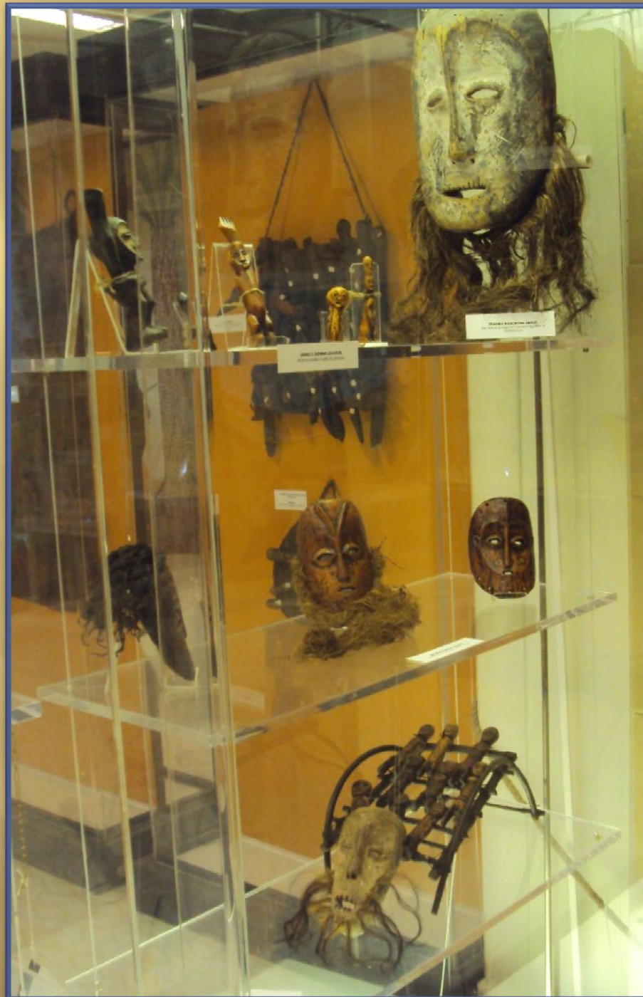
Mask of the Yoruba people, Nigeria