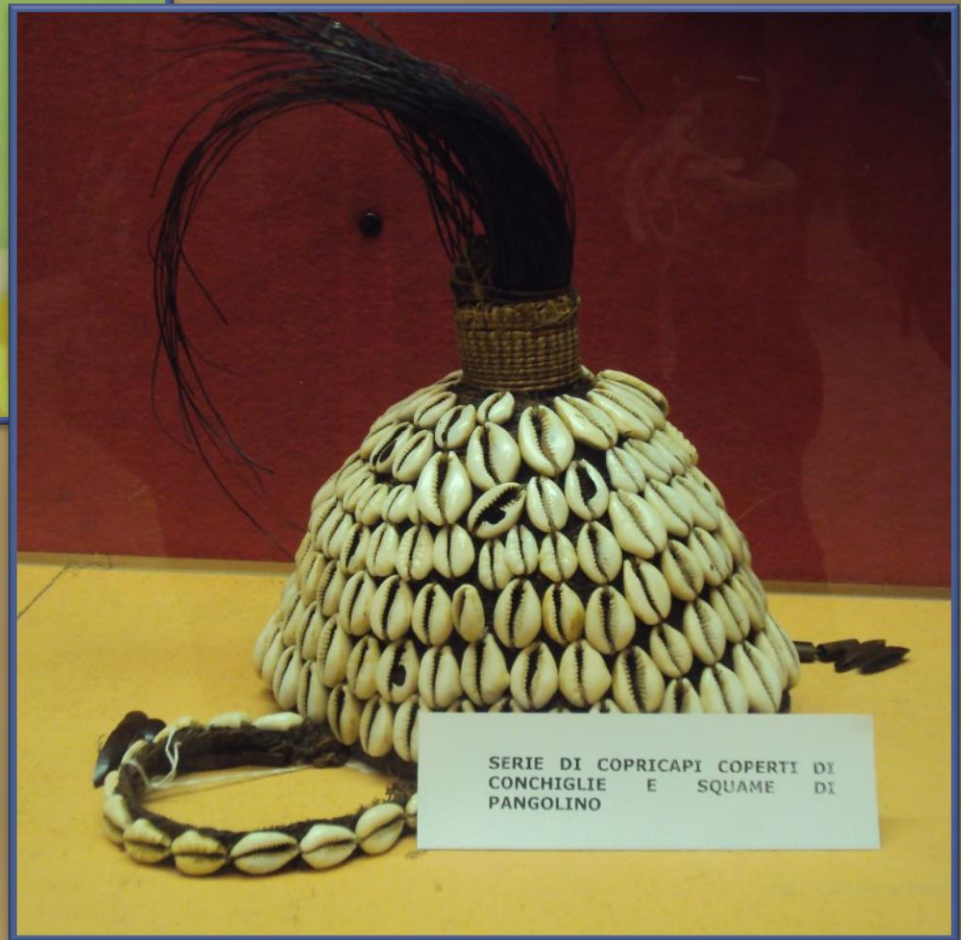
SERIE DI COPRICAPI COPERTI DI CONCHIGLIE E SQUAME DI PANGOLINO