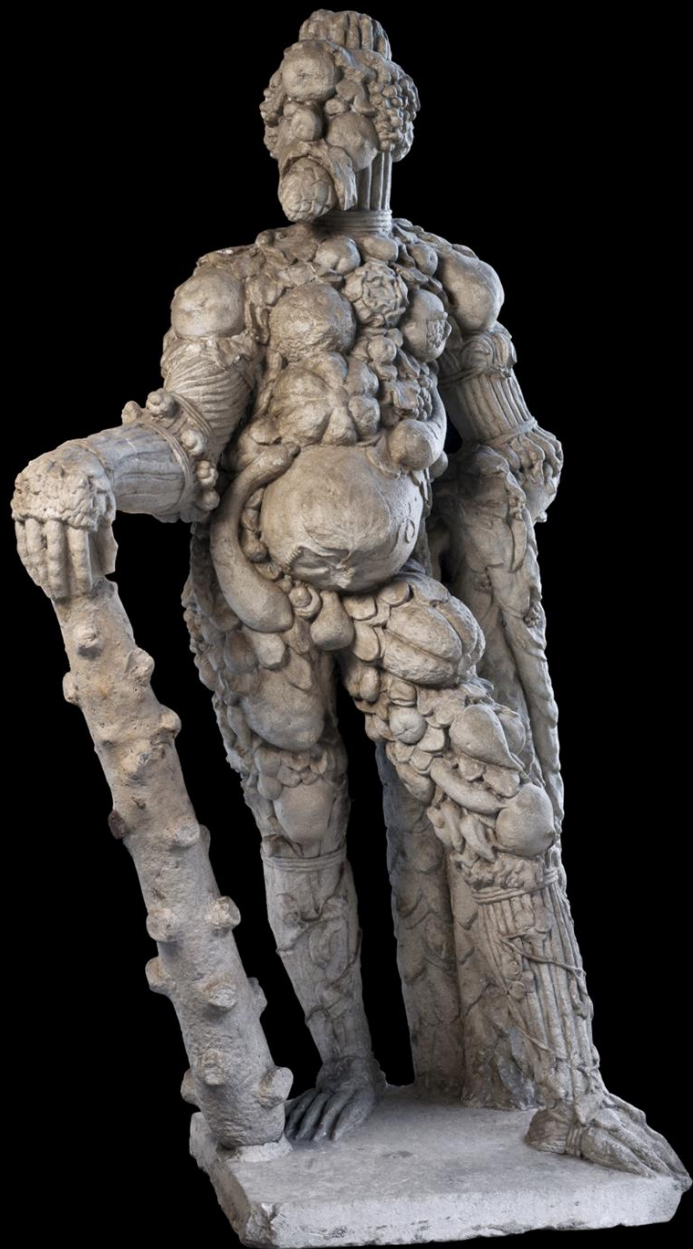
Anonimo "Il guardiano dell'orto"