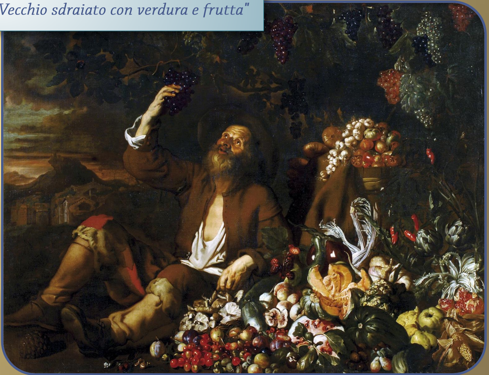
Jodocus Van De Hamme "Vecchio sdraiato con verdura e frutta"