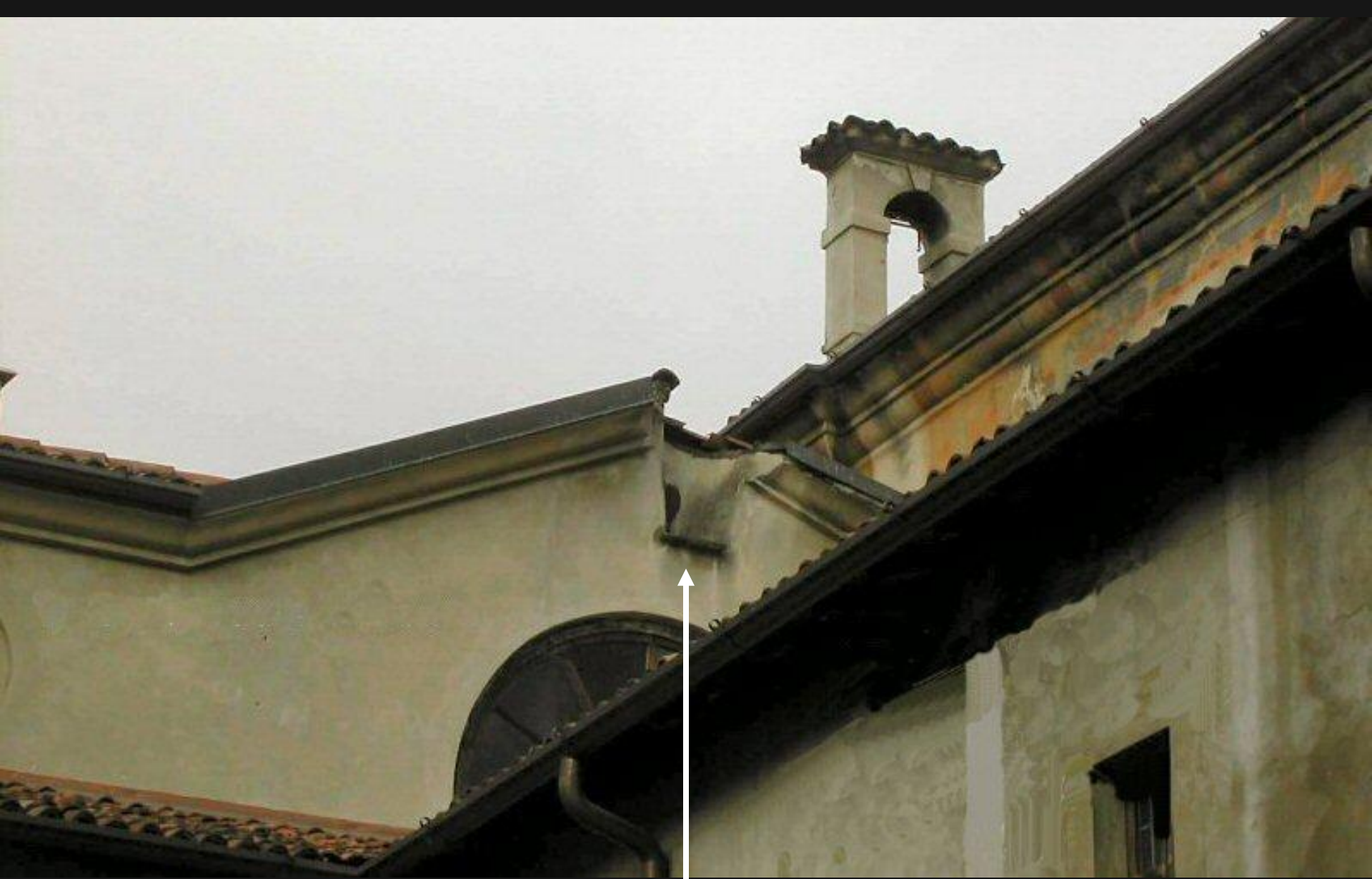
Secondo chiostro - Scasso per piastra con foro gnomonico