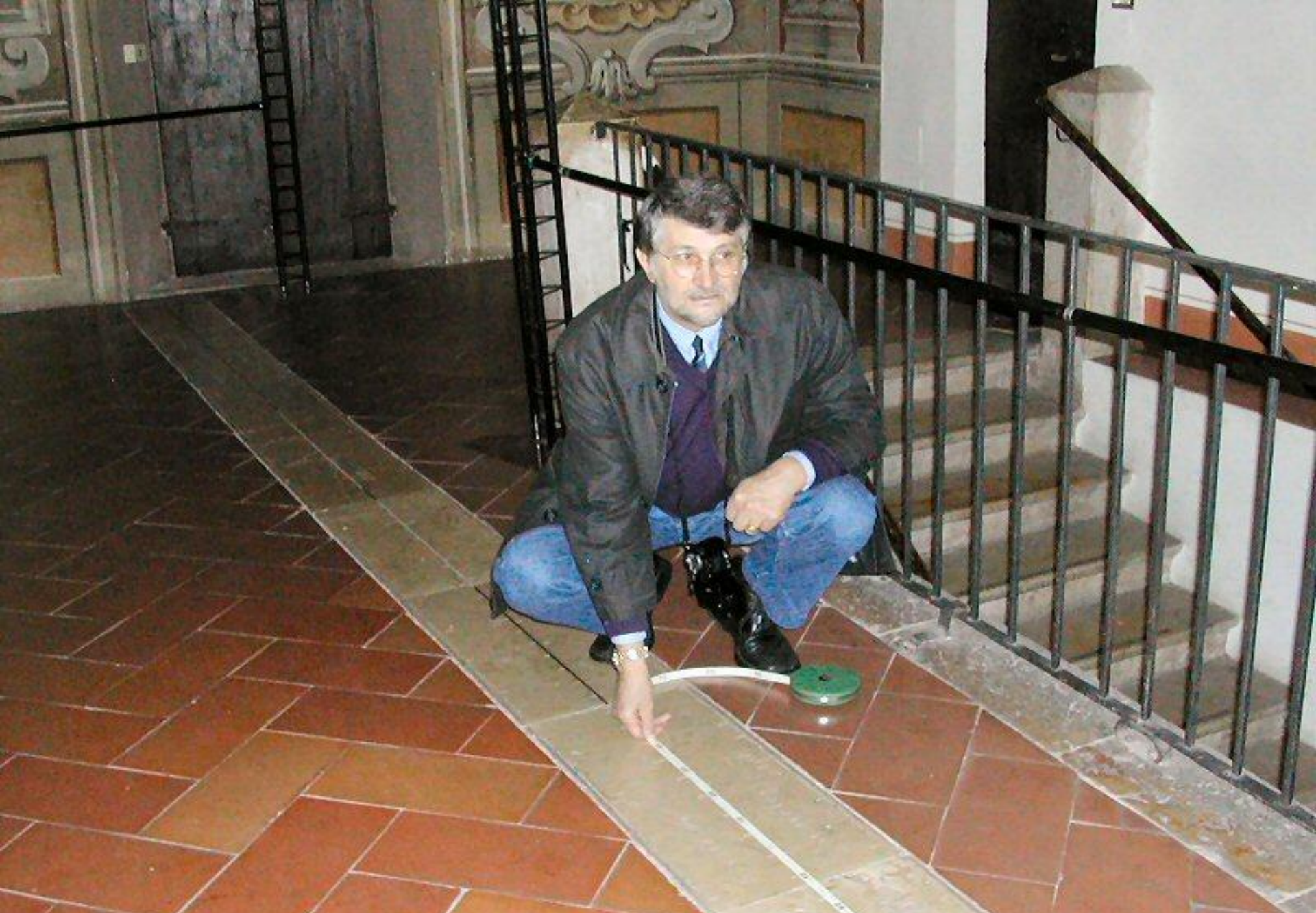
Sala della Meridiana di S. Giuseppe - Rilievi