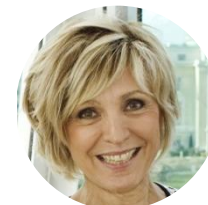
Evelyne Dhéliat, TF1 (Francia)

"Il Forum è stato fondamentale per la mia professione."