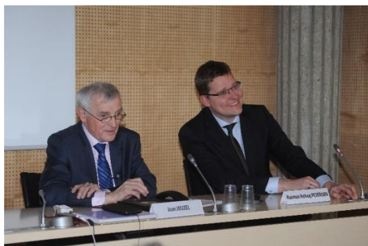
Jean Jouzel, presidente di Météo et Climat, e Rasmus Helveg Peterson, Ministro Danese per il Clima e l'Energia.

“Come il 5° Rapporto di Valutazione dell'IPCC può fornire alla cronaca informazioni meteorologiche e climatiche”