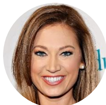
Ginger Zee, ABC News (USA)

"Il workshop ha avuto un impatto molto positivo e significativo sul mio lavoro quotidiano. Adesso ho aggiunto una parte di educazione climatica al mio bollettino meteorologico. Informo il pubblico circa i cambiamenti climatici, lo sviluppo sostenibile e i diversi modi per vivere in maniera ecologica."