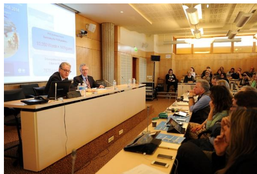
Thomas Stocker e Jonathan Lynn (IPCC) durante la presentazione "Cambiamenti climatici constatati e futuri: i fondamenti della scienza fisica."

“Comprendere il cambiamento climatico: La 5° Relazione di Sintesi dell'IPCC”