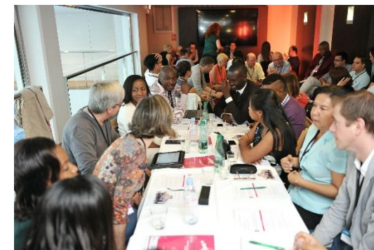
Uno dei 4 gruppi di lavoro sul tema "Africa: strategie efficaci sul lungo termine per fornire informazioni sui cambiamenti climatici a coloro che ne hanno maggiormente bisogno"