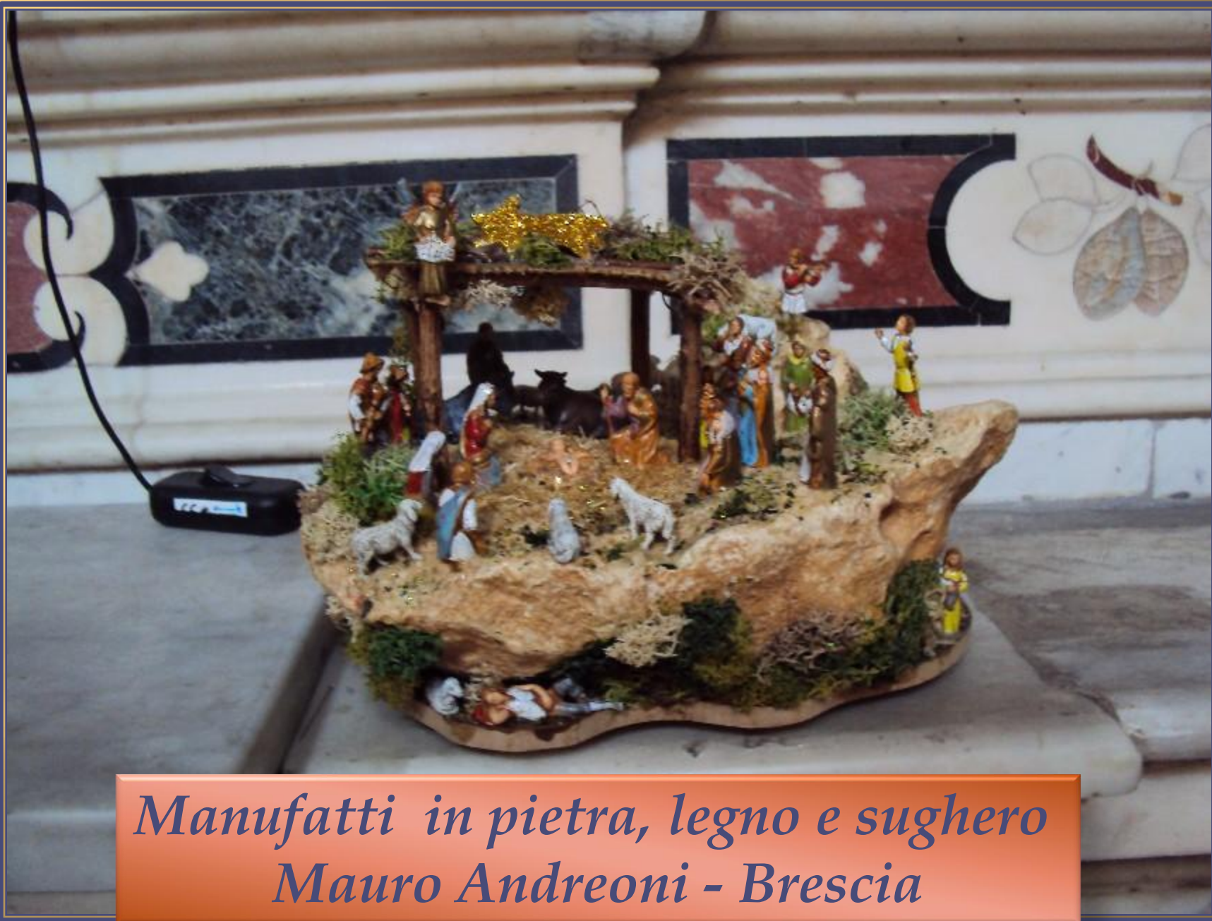
Manufatti in pietra, legno e sughero Mauro Andreoni - Brescia