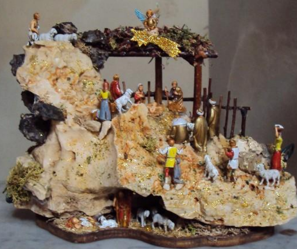
Manufatti in pietra, legno e sughero Mauro Andreoni - Brescia