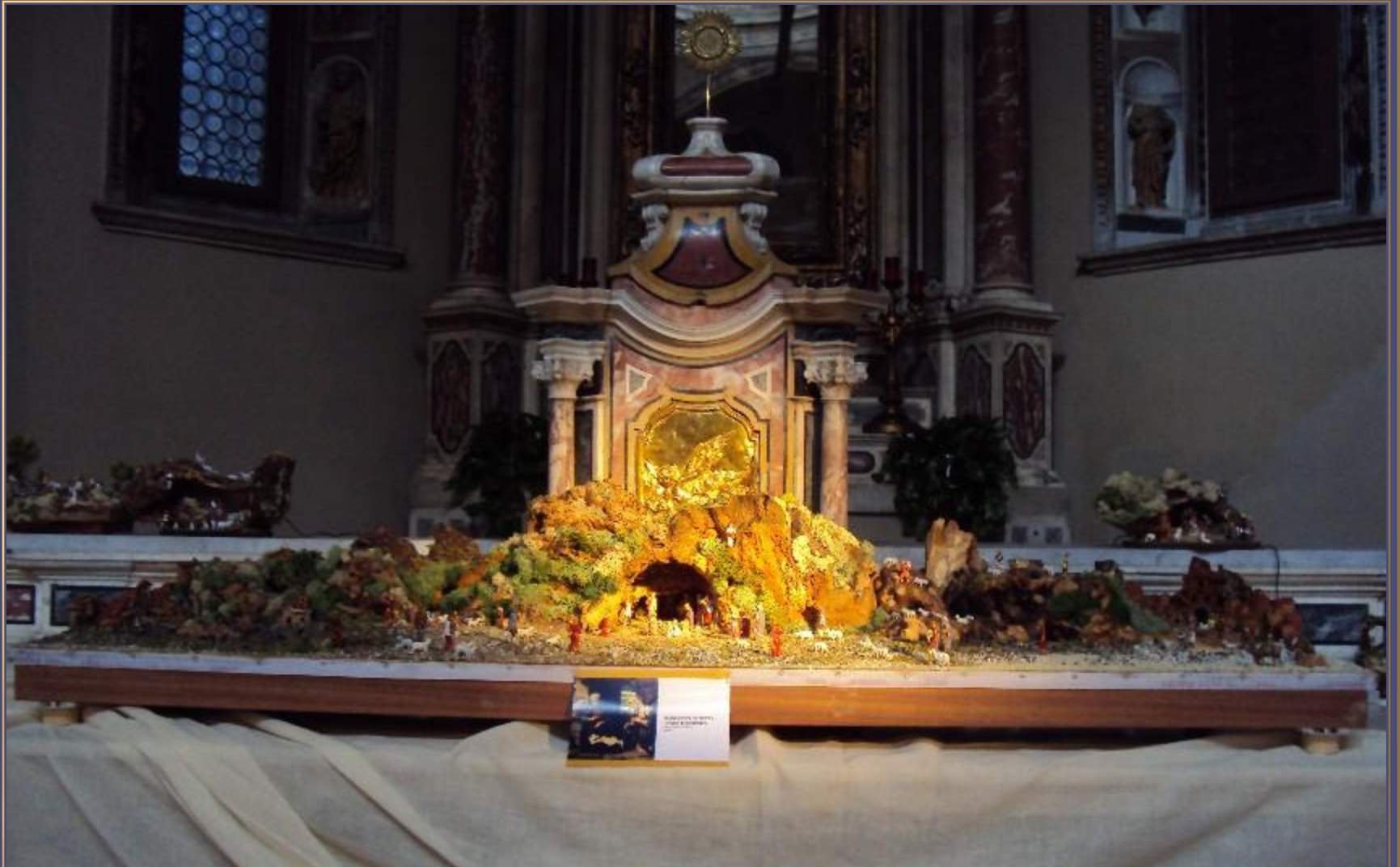
Manufatti in pietra, legno e sughero Mauro Andreoni - Brescia