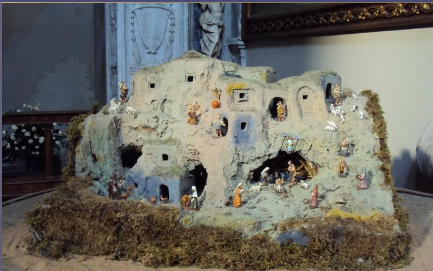
Natività ispirata ai Sassi Matera Fedeli e Devoti - Pizzighettone (Cr)