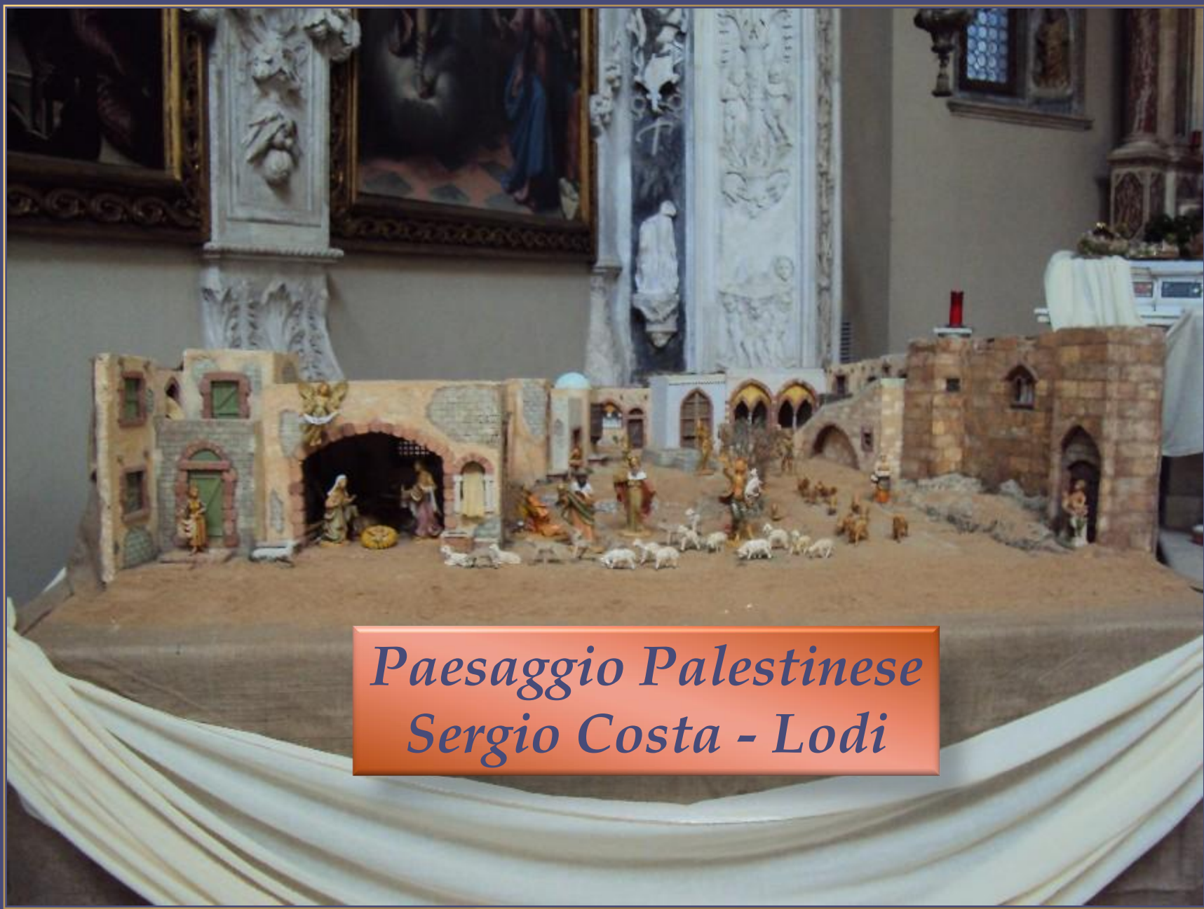
Paesaggio Palestinese Sergio Costa - Lodi